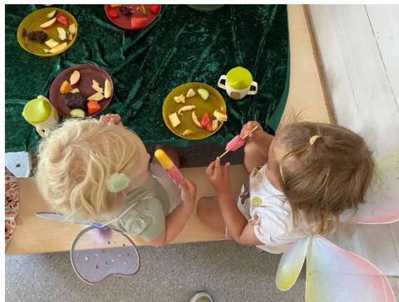
TO SOMMERFUGLER SOM GJØR SEG KLARE TIL Å FLY VIDERE TIL "STOR AVDELING"

Vi har også et «overgangsrituale». Småbarnsavdelingen har «Lille larven Aldrimett» som tema i juni. Dette avsluttes med en overgangsfest for de som skal over på stor avdeling. De koser seg med «larvemat» og de som skal slutte på avdelingen får sommerfuglvinger på for å markere at de skal «fly» videre til en større avdeling.