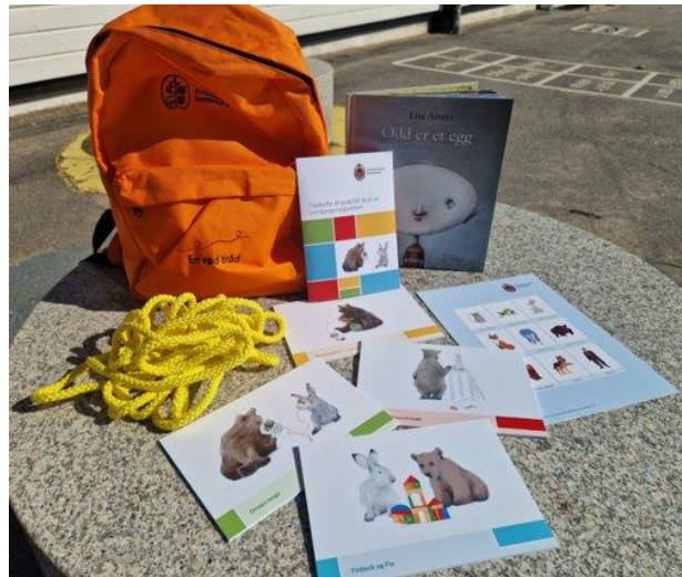
OVERGANGSSEKKEN MED INNHOLD

I juni markerer vi avslutningen med avskjedsfest avdelingsvis. På sommerfesten i regi av SU er det utdeling av diplomer og annet spennende opplegg.